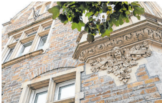
Die „Moselvilla 1900“ ist um die Jahrhundertwende 1900 erbaut worden. Am denkmalgeschützten Haus sind die Stilelemente der Zeit sichtbar.