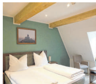
Die Zimmer sind modern eingerichtet, aber auch mit Platz für historische Elemente.

„Die ersten Wochen waren bereits sehr gut frequentiert. Lediglich das Hochwasser hat zu einigen