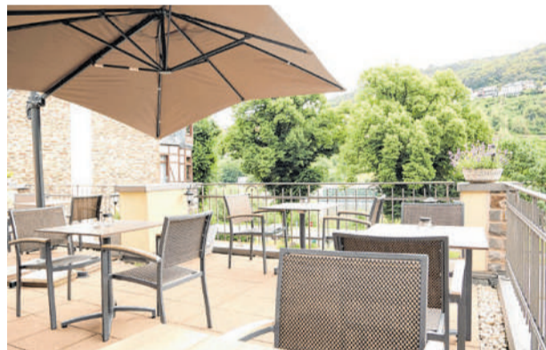
Wie wäre es mit einem Frühstück unter freiem Himmel? Vom Frühstücksraum aus gelangt man auf eine Terrasse mit Moselblick.

Übrigens: Wer im Frühsommer durch die Cochemer Ravenstraße gegangen ist, wird sicher schon oft vor der „Moselvilla 1900“ stehen geblieben sein, denn wenn der vor dem Haus stehende Magnolienbaum in voller Blüte steht, ist das äußere Ambiente perfekt.